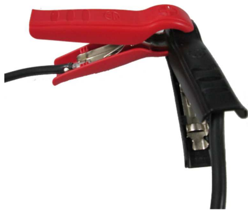
Abbildung 3: Ladezangen im Kurzschluss

Soll die Kabelkompensation wiederholt werden, kann die Messung in der Betriebsart Kabelkompensation durch Drücken der START-Taste erneut durchgeführt werden.