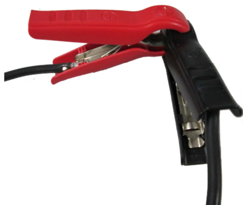
Απεικόνιση 3: Πένσες φόρτισης βραχυκυκλωμένες

Αν πρέπει να επαναληφθεί η αντιστάθμιση καλωδίων, τότε μπορεί να εκτελεστεί η μέτρηση στον τύπο λειτουργίας "Αντιστάθμιση καλωδίων" πατώντας εκ νέου το πλήκτρο START.